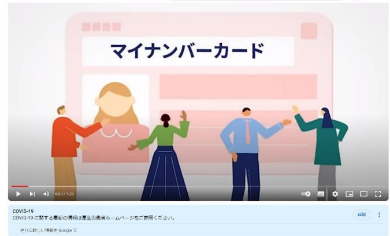
マイナンバーカード「いま」と「これから」

マイナンバーカード「いま」と「これから」 (youtube.com) https://www.youtube.com/watch?v=N2HlIPjnobY