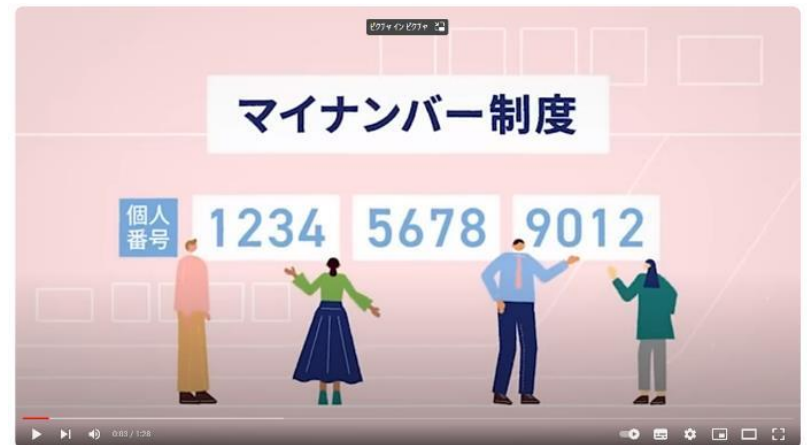
マイナンバー 制度「報告」と「対策」

マイナンバー 制度「報告」と「対策」 (youtube.com) https://www.youtube.com/watch?v=cPGselfiWxc