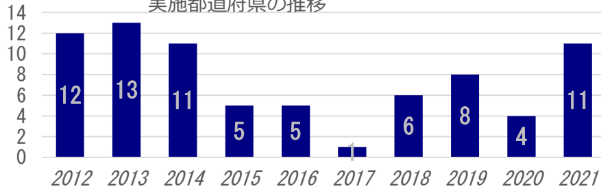
実施都道府県の推移

* 歯科医師会様の支援の実施県 岡山県 (989件) 山口県 (751件) 香川県 (520件) 高知県 (424件) 島根県 (320件)