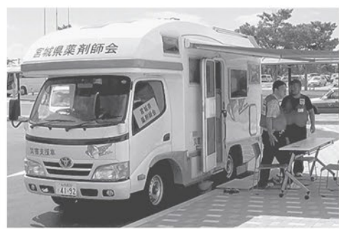
モバイルファーマシー 車内

2011年に起きた東日本大震災のときは、薬局が機能しなくなり、避難住民がかかりつけ薬局に行くことができない地域が発生した。その経験から、モバイルファーマシーが生まれ、現在、11台が日本各地で待機している。熊本地震や広島・岡山の水害ではボランティアの薬剤師が乗り込ん