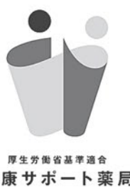
厚生労働省基準適合 健康サポート薬局

少体力のある人は「葛根湯」、虚弱な人は「桂枝湯」といったふうに教えてくれる。同じ頭痛薬でも、どれも同じというわけではない。なかには長期間使うと効きにくくなる薬もある。患者