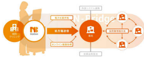
*NB-Stationは、薬局向け基盤サービス「N-Bridge」の処方箋情報連携機能です。

患者が簡単な操作で処方箋をスキャンし、診療機関から薬局へデータを直接送信できるシステムです。薬局での待ち時間が短縮され、患者の負担を軽減します。