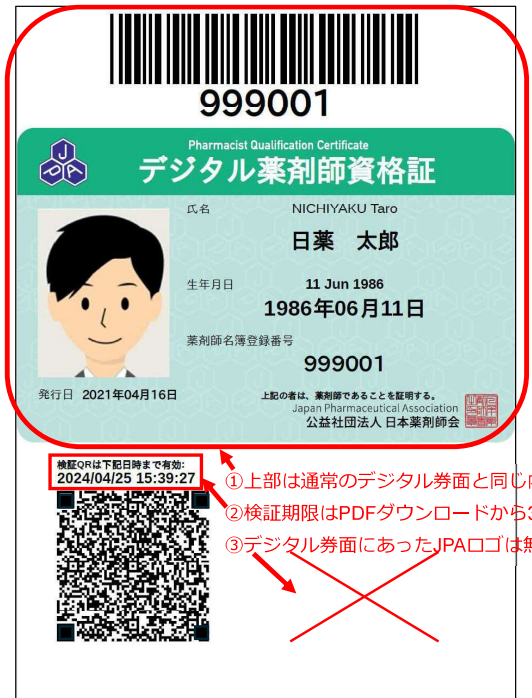
オフライン券面の特徴