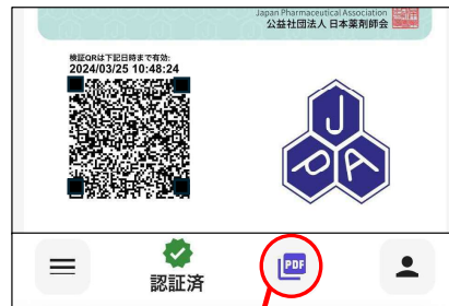
オフライン券面の出力ボタン

これを用いて、大規模災害等で一時的にインターネットが途絶した環境においても、派遣薬剤師等が その場では簡易的な本人確認 を行い、 インターネット復旧後にブロックチェーンを用いた厳密な有効性確認 を行うことが可能です。