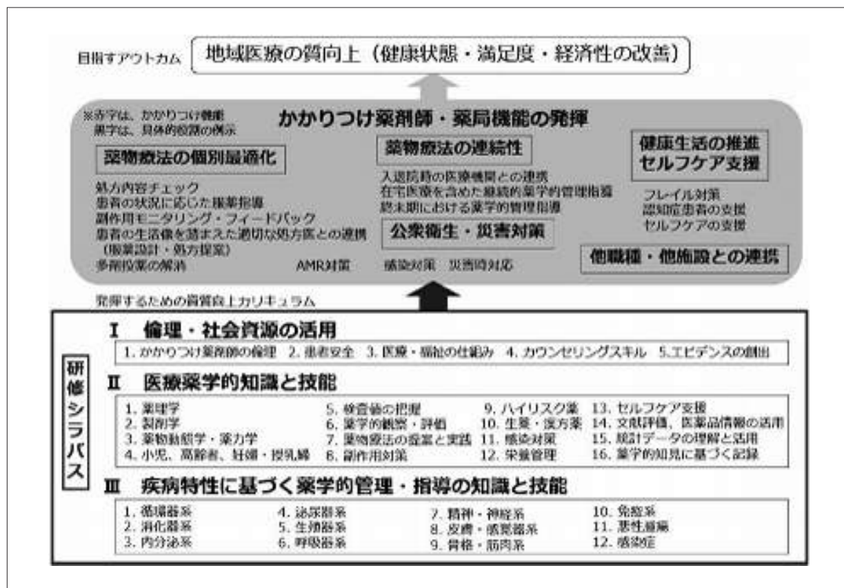
図2 薬剤師のかかりつけ機能強化研修の概要（平成30年度時点） （注：令和2年度にシラバスを一部改訂。図3参照）

研修のあり方について検討を進め、また今後、患者等のニーズに応じて強化・充実すべき「高度薬学管理機能」や「健康サポート薬局機能」との関連も踏まえて、本「薬剤師のかかりつけ機能強化のための研修シラバス」を作成した（図2）。